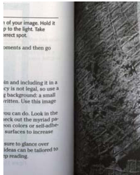
單向 LED 光源 - 陰影較多

高達 10mm 掃描景深，可有效掃描處理水彩油畫等實體物件的凹凸面，影像不會模糊失真。