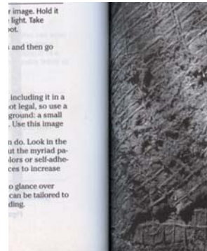
雙向 LED 光源 - 陰影較少